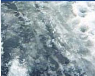
残水（雪解け水）が凍結します。