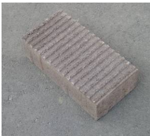
コンクリート製品

ポーラス製品は雨水、雪解け水を路面に残さず素早く地下浸透させことで、凍結して危険な道、水たまりで歩きにくい道を安全な路面にして、生活環境と地球環境を守ります。